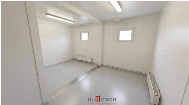
Lagerhalle_Bu \ddot{u} rocontainer